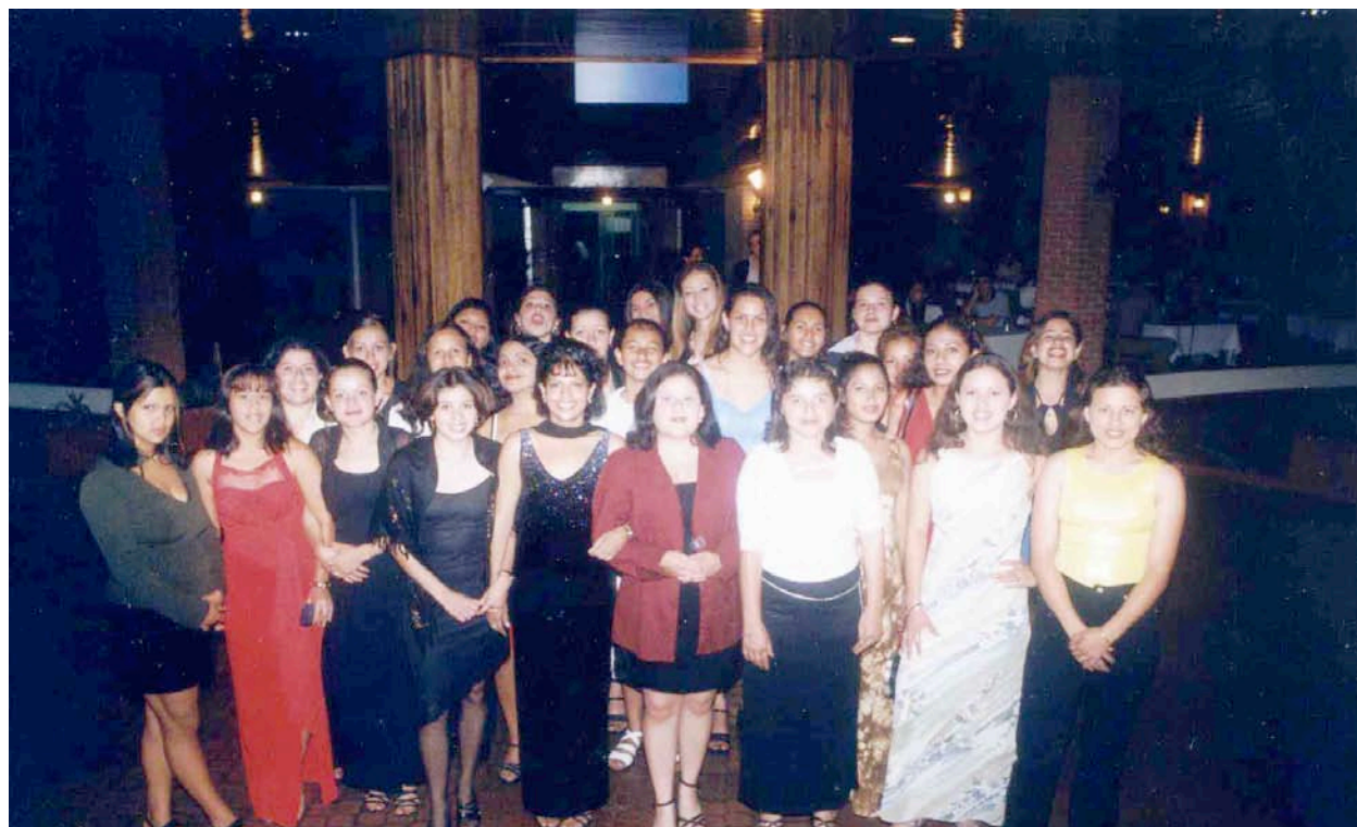
Acto de graduación de la jóvenes de Desamparados.