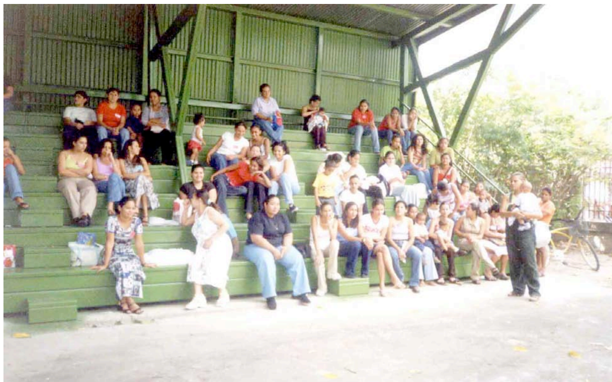
Jóvenes de los grupos de Liberia, Guanacaste.