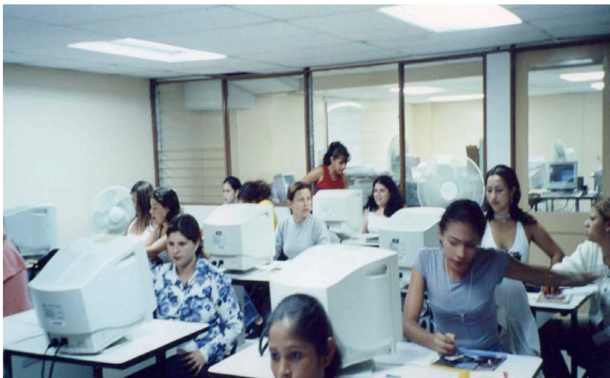
Jóvenes de Desamparados y Aserri capacitándose en administración de oficinas.