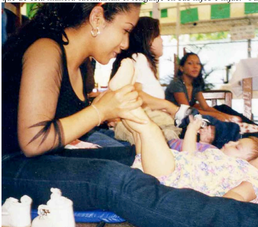
Las madres realizaron los masajes con gran habilidad.

También se les dijo que permitieran a sus hijos e hijas expresar lo que querían y sentían sin precipitarse diciendo ellas mismas lo que ellos o ellas querían decir, como si les leyeran la mente.