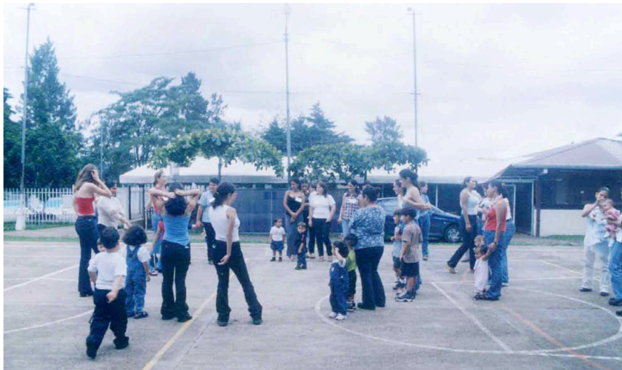
Actividades al aire libre

pretender que un niño o niña de cuatro años quiera estar todo el día sentado viendo televisión, ya que no sería saludable, lo mejor es que estén en constantemente movimiento, jugando, corriendo, observando, ensuciándose, etc.