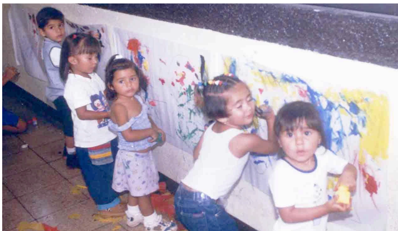
Al fin, la primera obra maestra colectiva.