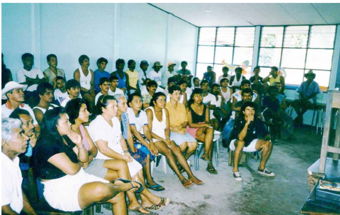
La capacitación constituye el eje central en los fondos locales. Pescadores artesanales en Manzanillo, Puntarenas.

De esta forma, los Fondos Locales de Solidaridad Social permiten apoyar el desarrollo productivo de los pobladores que presentan unas ideas de negocio factible y viable de financiar por parte de los administradores locales.