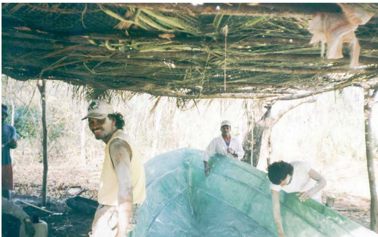
Pescadores artesanales de la Isla de Chira fabricando sus pangas con fibra de vidrio, durante el período de veda.