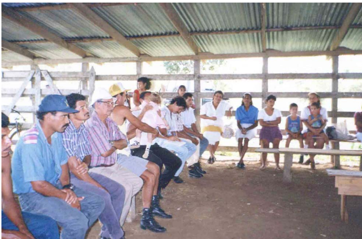
Lugareños buscando soluciones para el desarrollo rural, San Carlos de Alajuela.