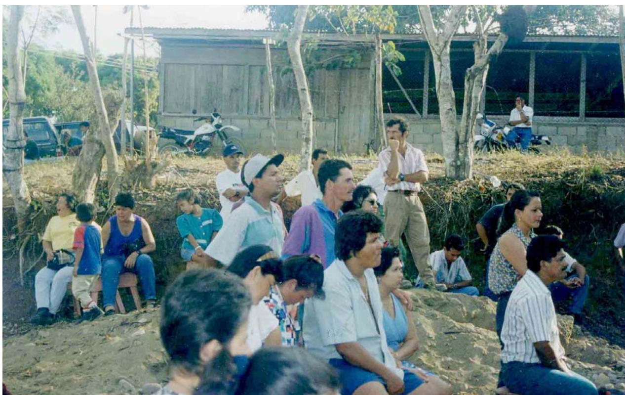
La organización de base permite construir el desarrollo rural. Sesión de los pobladores de Veracruz, Buenos Aires de Puntarenas