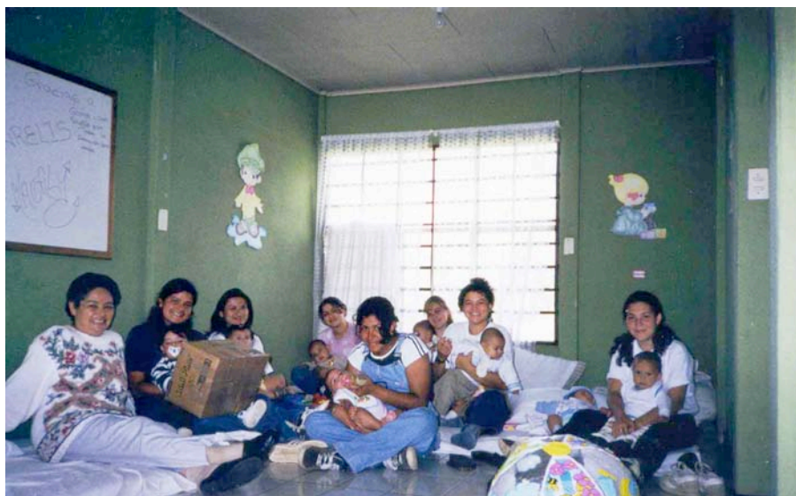
Cabaña de los bebés

Aquellas que iban terminando, se dedicaron a la atención de sus hijos e hijas y luego los llevaron a la cabaña de los bebés, donde pasarían el día con las Asistentes maternas.